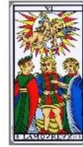
Soc 10 | 10