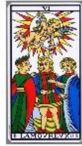
Nido 10 | 10