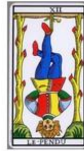
Lav 7 | 16