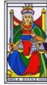
Rel 3 | 12