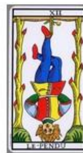
Lav 7 | 16