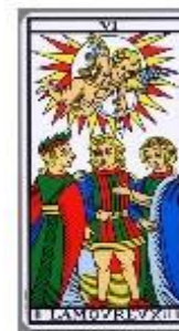
Soc 10 | 10