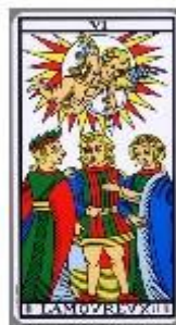
Nido 10 | 10