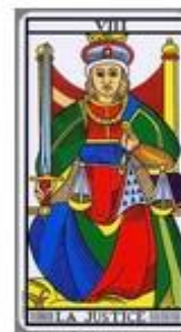
Rel 3 | 12